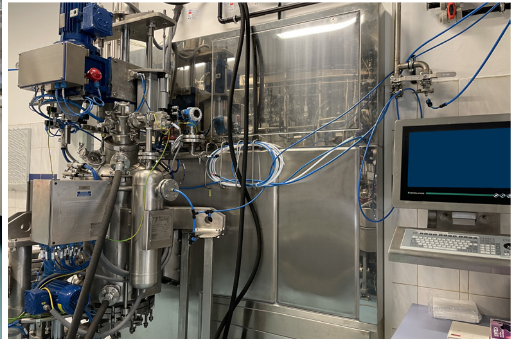
Cleanroom for an ISO 8 Drying Filter, Pilot Unit | Synthon, s.r.o. | Czech Republic | 2021

Timotec Reinraumssysteme a.s. supplied cleanroom systems under contracts executed by the BLOCK Group (now SPIE Central Europe).