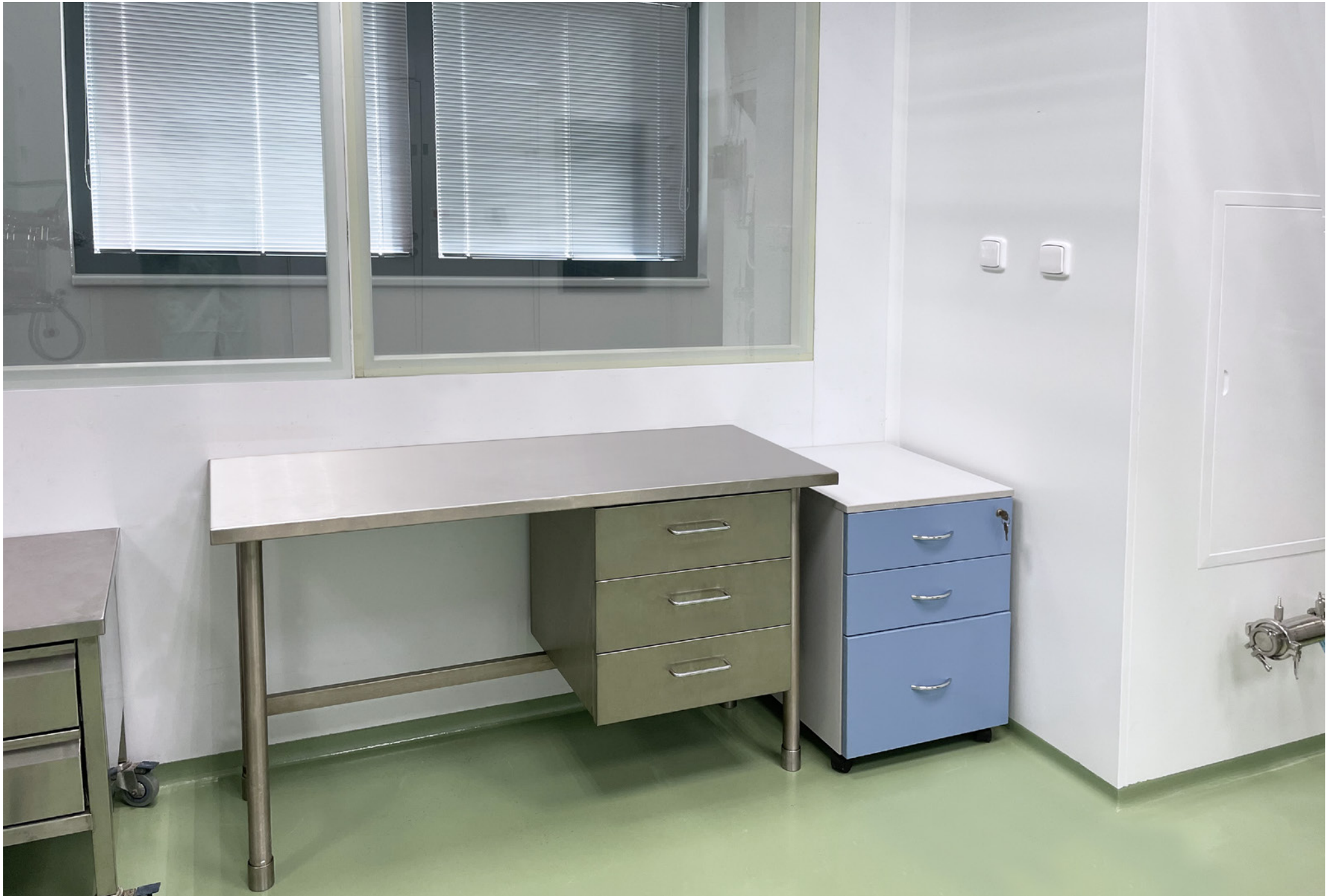
Cleanroom for an ISO 8 Drying Filter, Pilot Unit | Synthon, s.r.o. | Czech Republic | 2021

Timotec Reinraumsysteme a.s. supplied cleanroom systems under contracts executed by the BLOCK Group (now SPIE Central Europe).