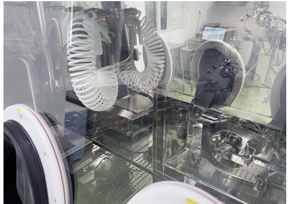
Cleanroom for an ISO 8 Drying Filter, Pilot Unit | Synthon, s.r.o. | Czech Republic | 2021

Timotec Reinraumsysteme a.s. supplied cleanroom systems under contracts executed by the BLOCK Group (now SPIE Central Europe).