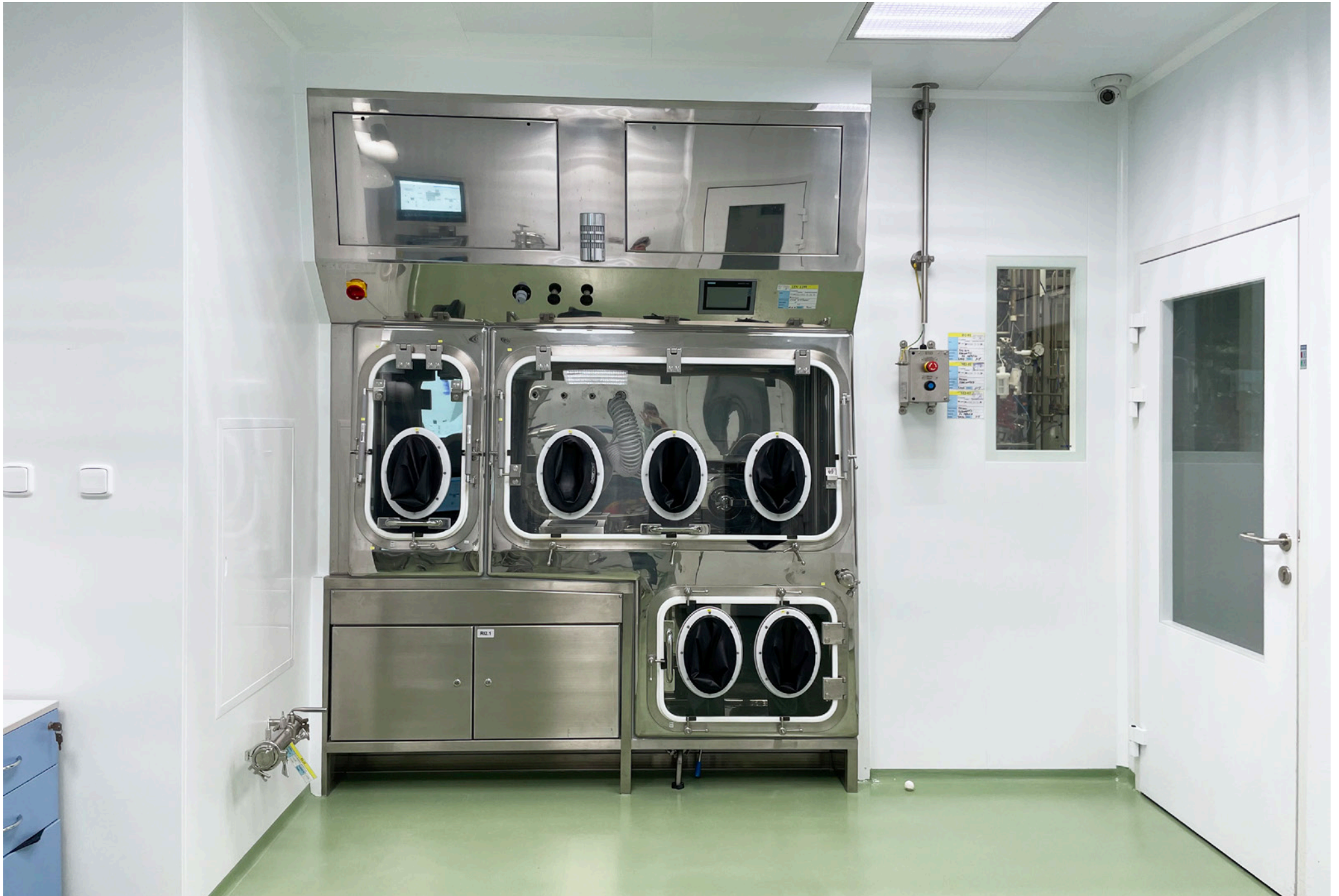
Cleanroom for an ISO 8 Drying Filter, Pilot Unit | Synthon, s.r.o. | Czech Republic | 2021

Timotec Reinraumsysteme a.s. supplied cleanroom systems under contracts executed by the BLOCK Group (now SPIE Central Europe).