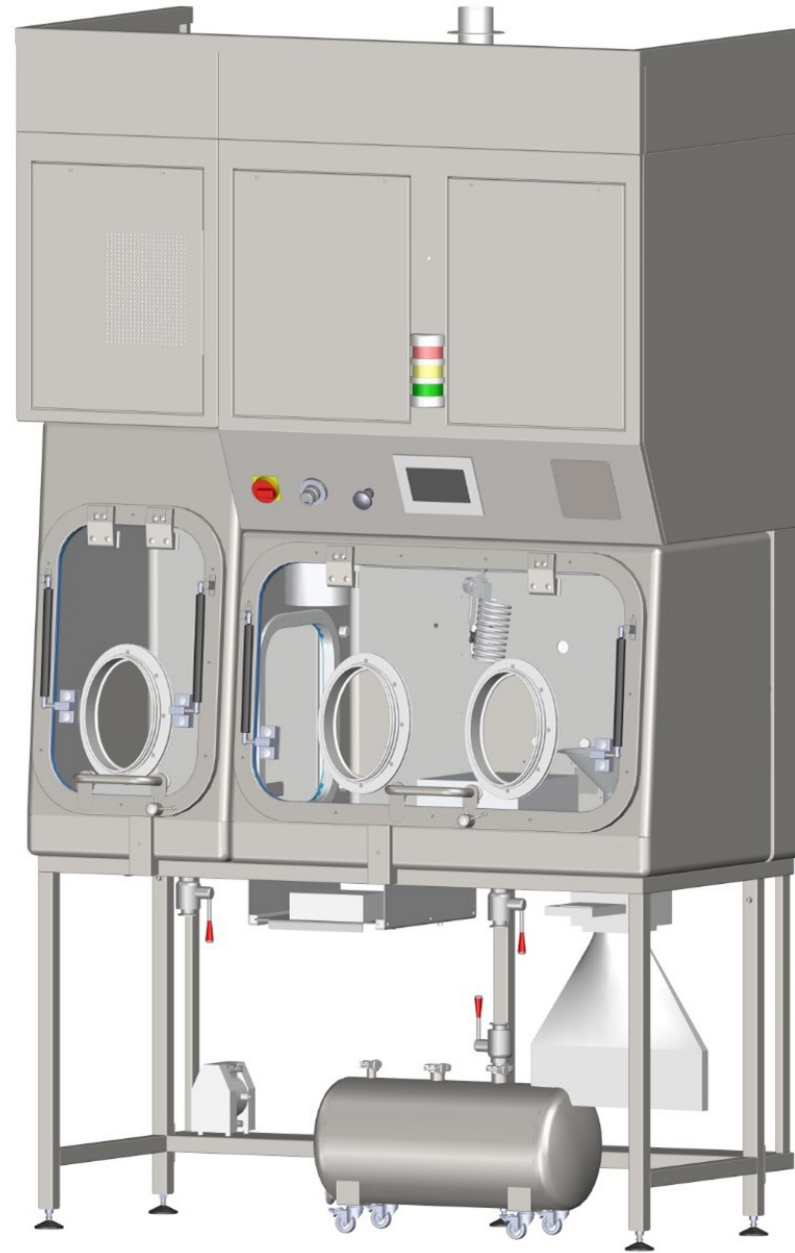
Isolator for Spray Dryer | Synthon, s.r.o. | Czech Republic