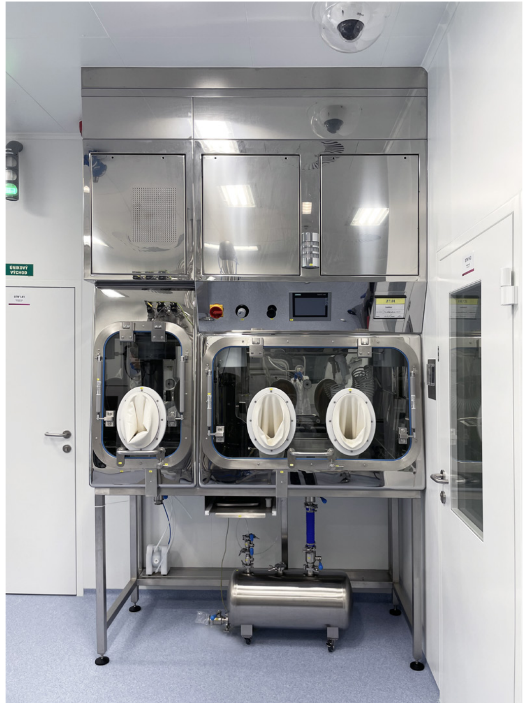
Isolator for Spray Dryer | Synthon, s.r.o. | Czech Republic